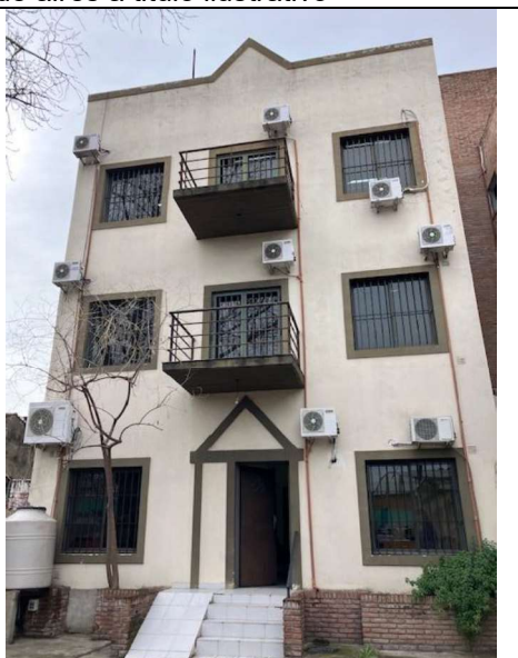
vista contra frente inmueble y equipos